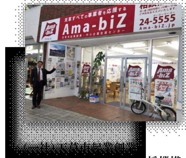
中小企業支援機構

これまで：地場企業 100社 100人の雇用 これから： 100社 300人 を目指して！